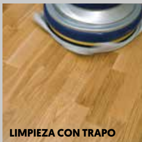
LIMPIEZA CON TRAPO

La superficie recién tratada se puede usar con precaución al día siguiente, y estará totalmente endurecida al cabo de 7 días en condiciones normales en interiores.