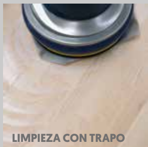
LIMPIEZA CON TRAPO