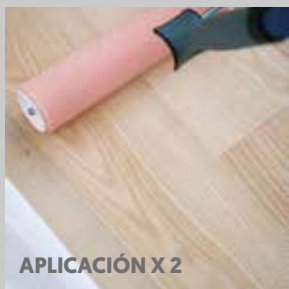
APLICACIÓN X 2

Mantenimiento semestral: Master Care, #684125