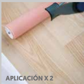
APLICACIÓN X 2

Mantenimiento semestral: Master Care, #684125