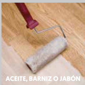
ACEITE, BARNIZ O JABÓN